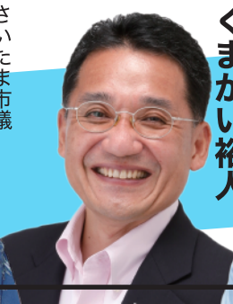
参議院議員 くまがい裕人